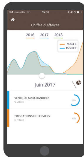
Aperçu en version mobile